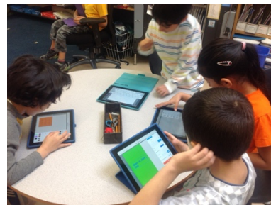
學生共同創作故事

平板具備多元素材與可以不斷修改的特性，能激發學生的創意，促進彼此之間互相學習合作。