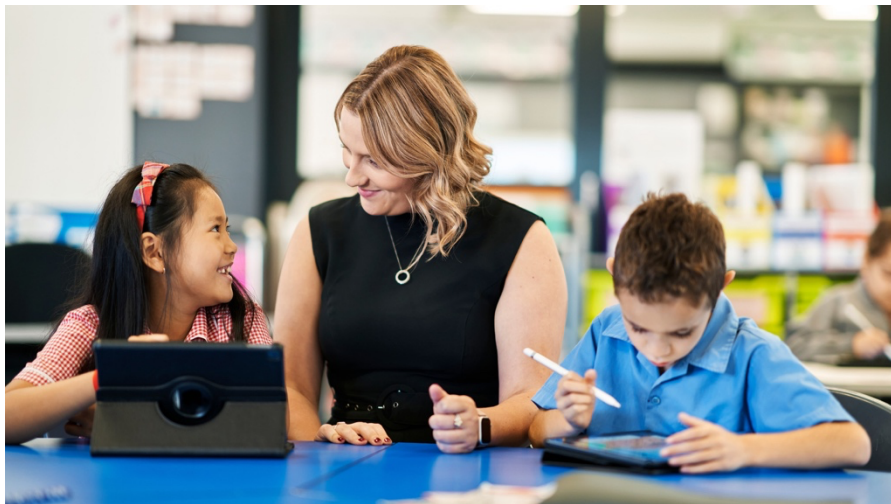
澳洲小學的平板融入教學

圖片取自： https://www.apple.com/ae/newsroom/2021/03/australian-primary-school-drives-innovation-and-creativity-with-ipad/