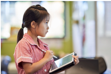
澳洲小學生用繪圖和全班分享自己的想法

平板可以讓學生發揮創意記錄與表達他們所學習到的內容，例如製作電子書、影片、簡報、廣播節目(podcast)等多元方式，有助符合不同學習風格的需求，促進適性學習。